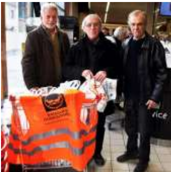
(Photo : Le Lions Club de la Vallée du Var » au Carrefour Market de Puget-Théniers)